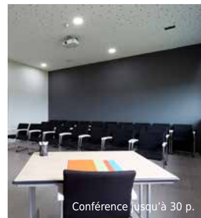
Conférence jusqu'à 30 p.