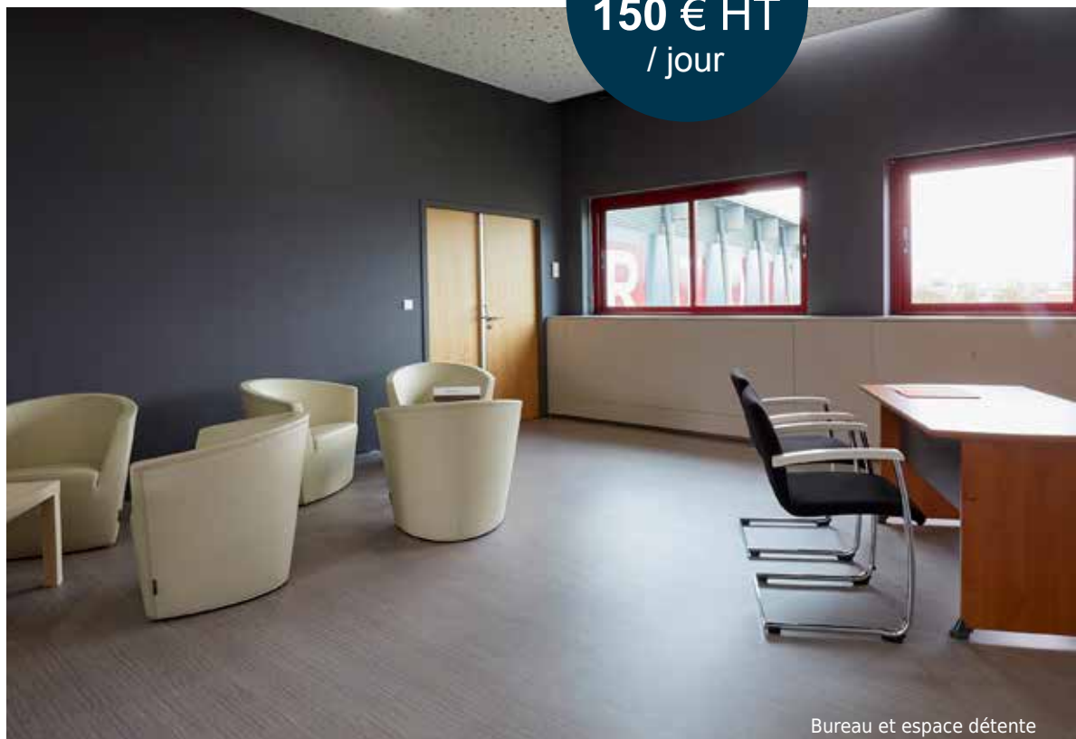
Bureau et espace détente

WIFI GRATUIT Accès haut débit dans toutes les salles