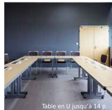
Table en U jusqu'à 14 p.